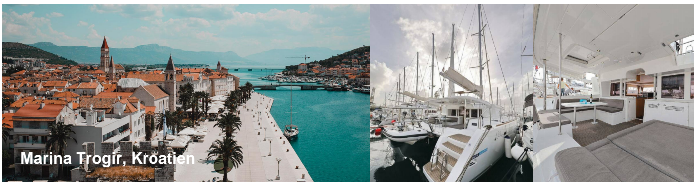
Marina Trogir, Kroatien