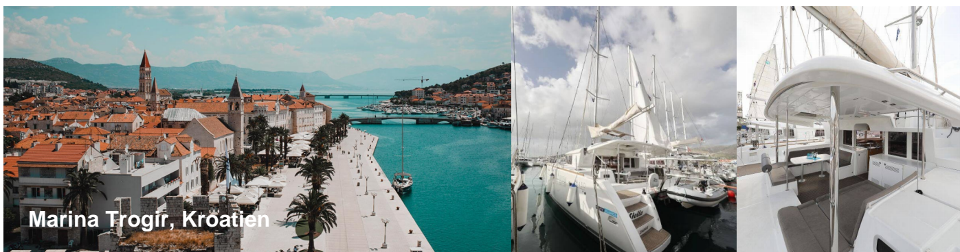
Marina Trogir, Kroatien