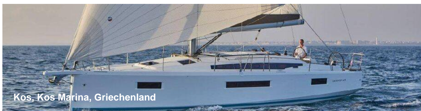
Kos, Kos Marina, Griechenland