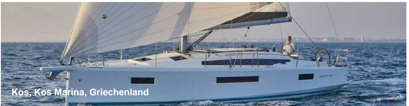
Kos, Kos Marina, Griechenland