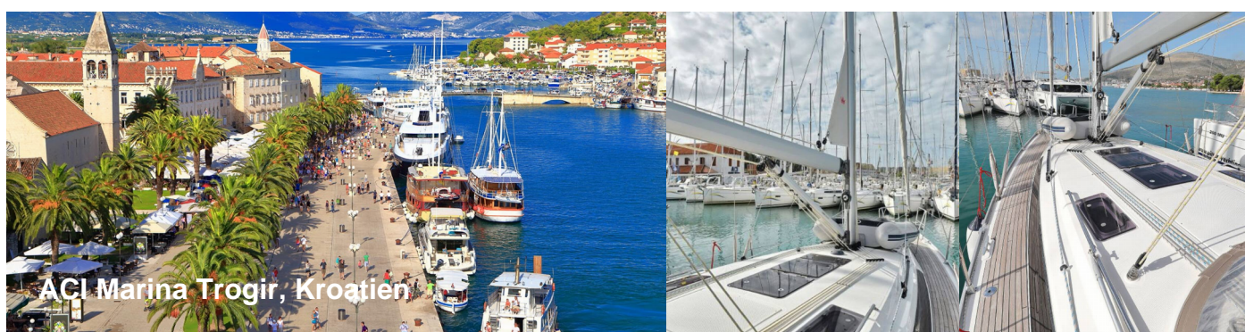
ACI Marina Trogir, Kroatien