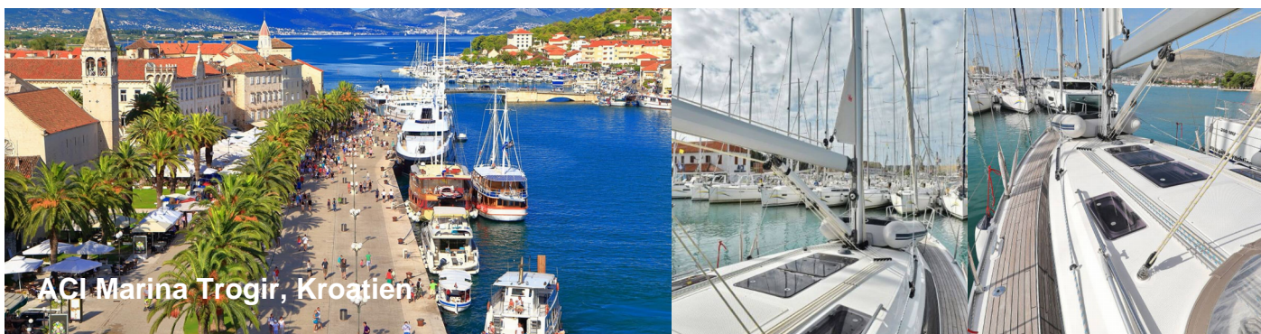
ACI Marina Trogir, Kroatien