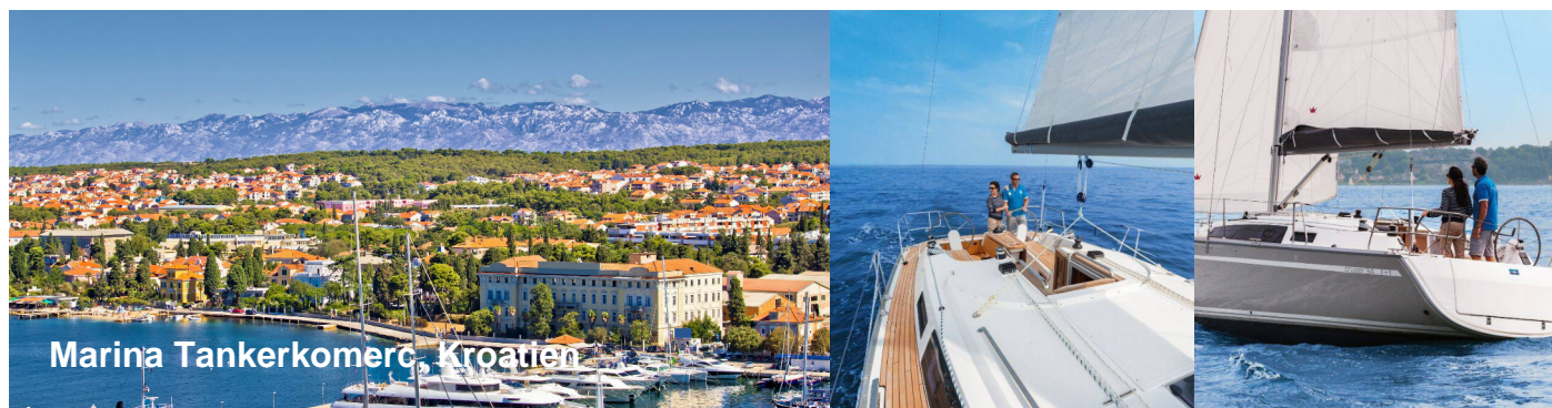
Marina Tankeromerc, Kroatien