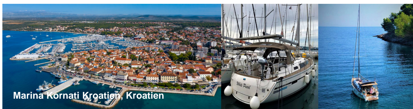
Marina Kornati Kroatien, Kroatien