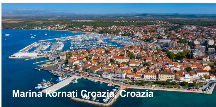
Marina Kornati Croazia, Croazia