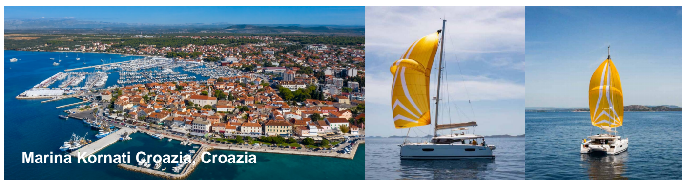
Marina Kornati Croazia, Croazia