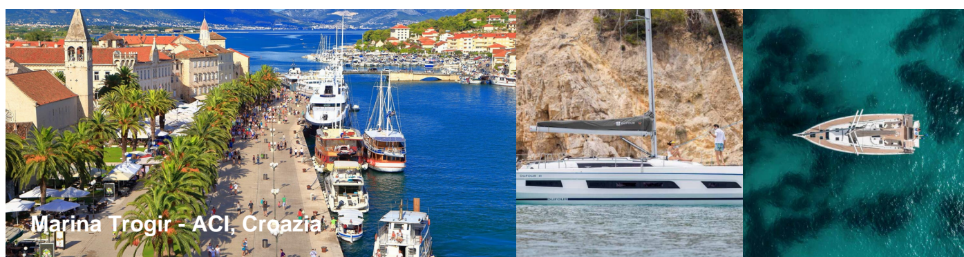
Marina Trogir - ACI, Croazia