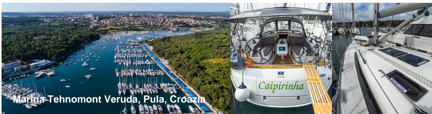
Marina Tehnomont Veruda, Pula, Croazia