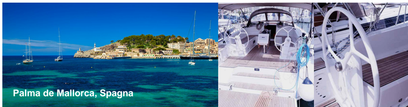
Palma de Mallorca, Spagna