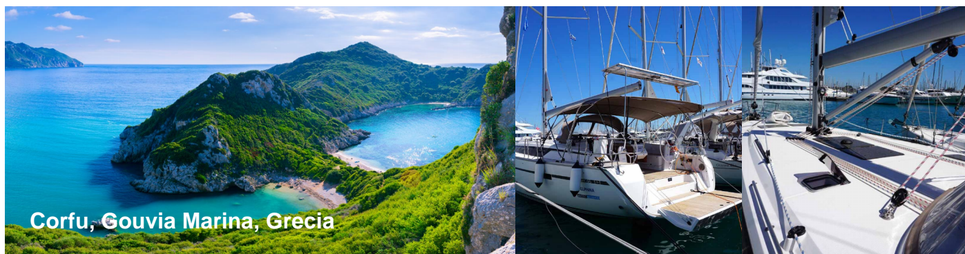
Corfu, Gouvia Marina, Grecia