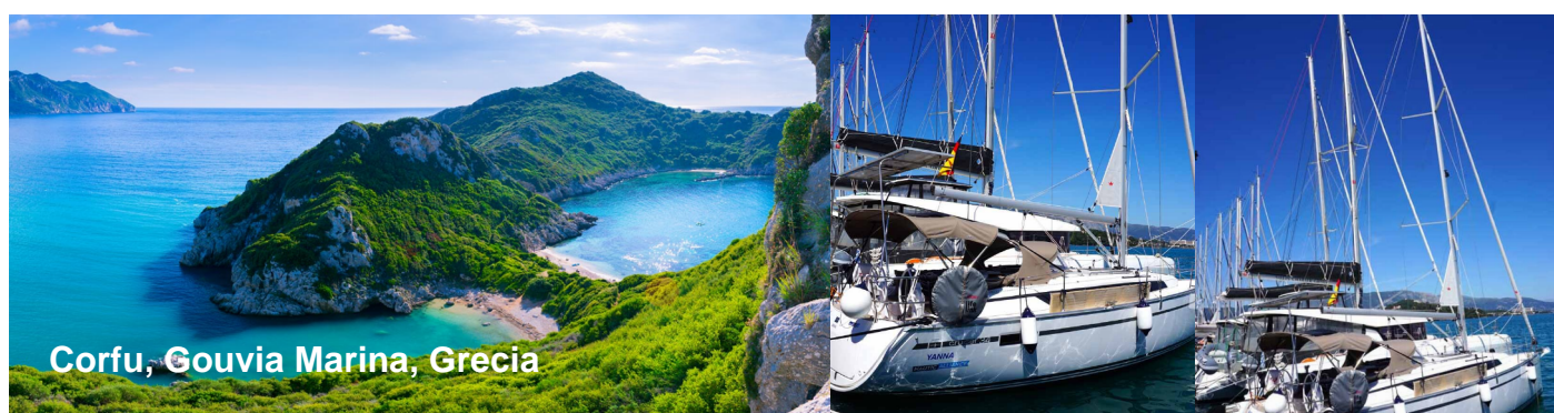
Corfu, Gouvia Marina, Grecia