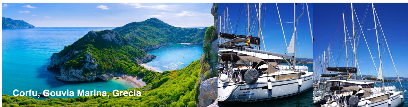
Corfu, Gouvia Marina, Grecia