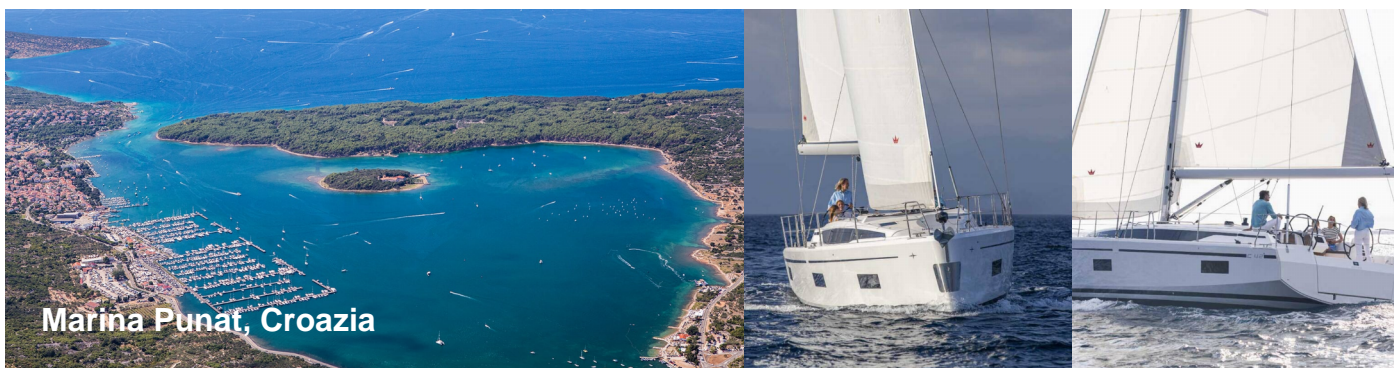
Marina Punat, Croazia