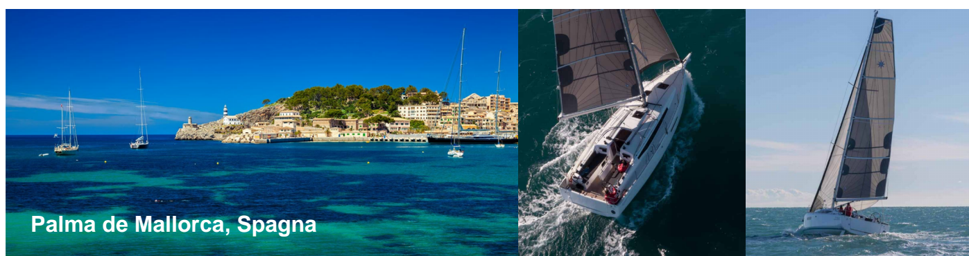
Palma de Mallorca, Spagna