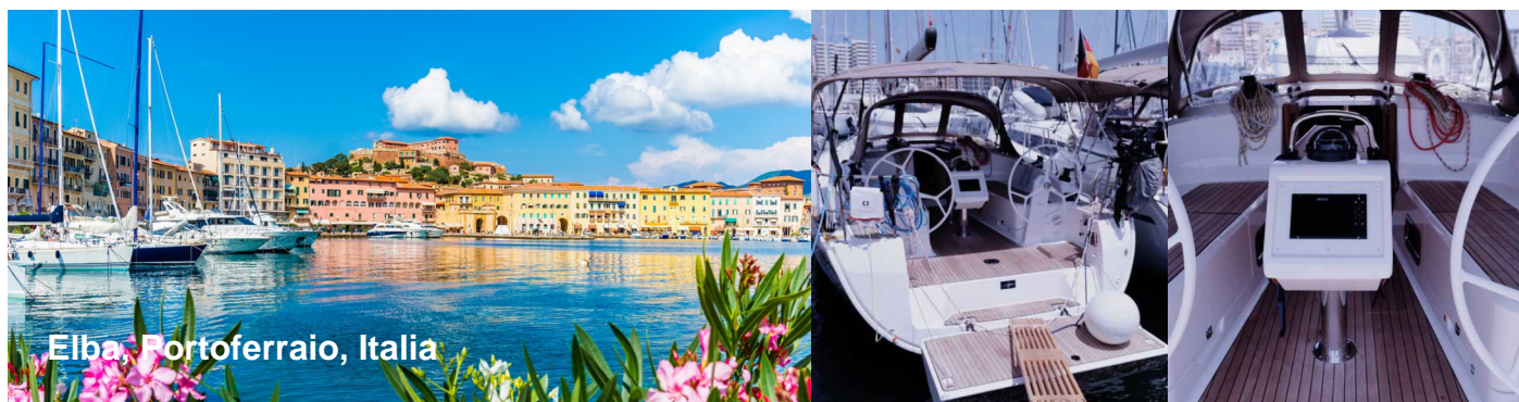
Elba, Portoferraio, Italia