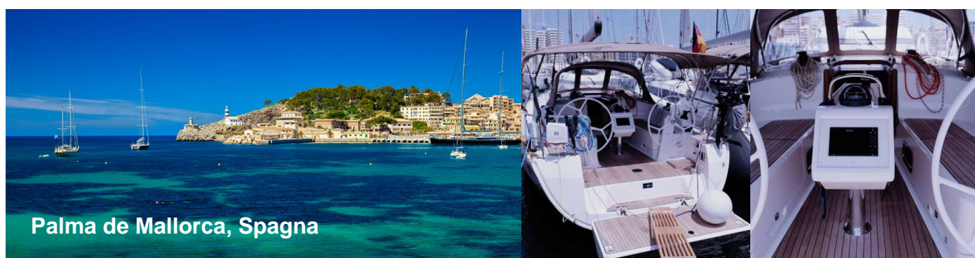
Palma de Mallorca, Spagna