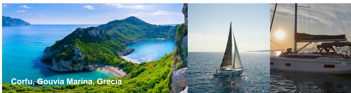
Corfu, Gouvia Marina, Grecia