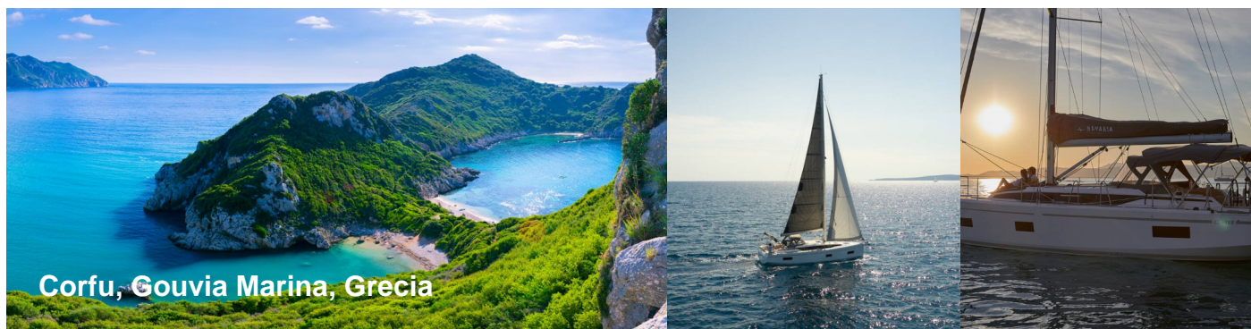
Corfu, Gouvia Marina, Grecia