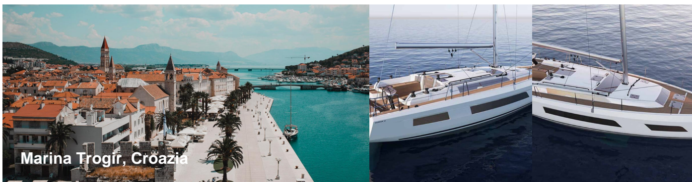
Marina Trogir, Croazia