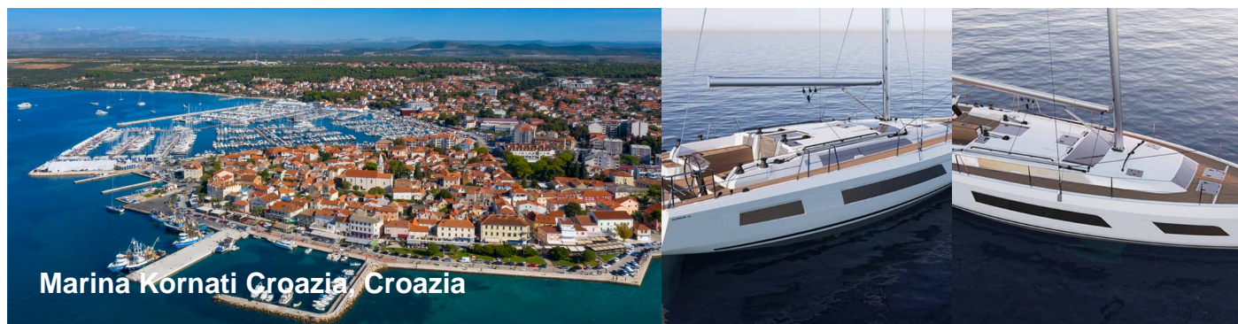
Marina Kornati Croazia, Croazia