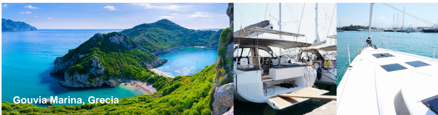
Gouvia Marina, Grecia