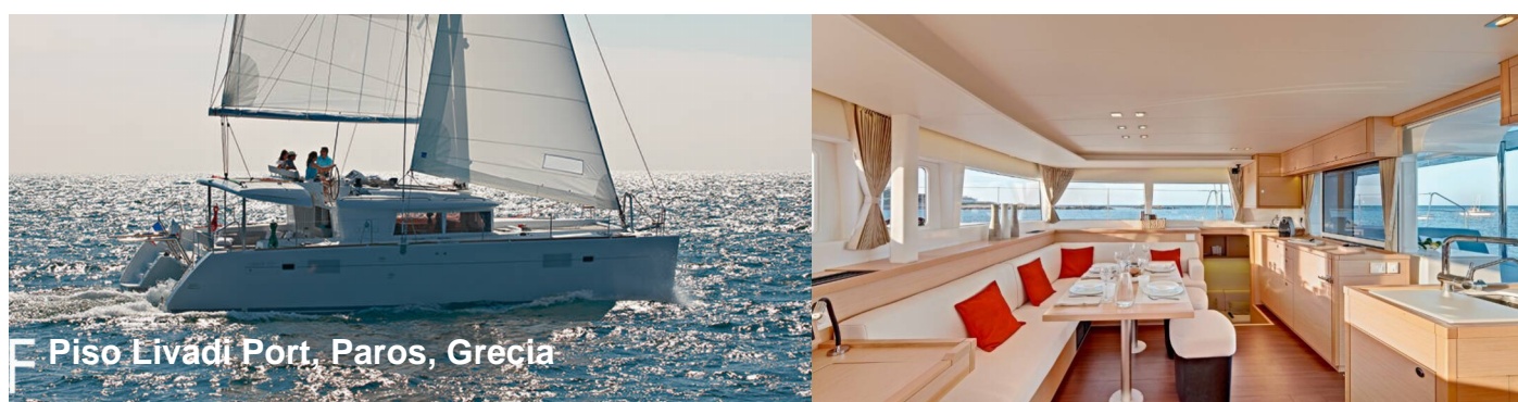
Piso Livadi Port. Paros, Grecia