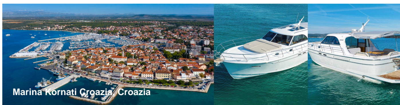
Marina Kornati Croazia, Croazia