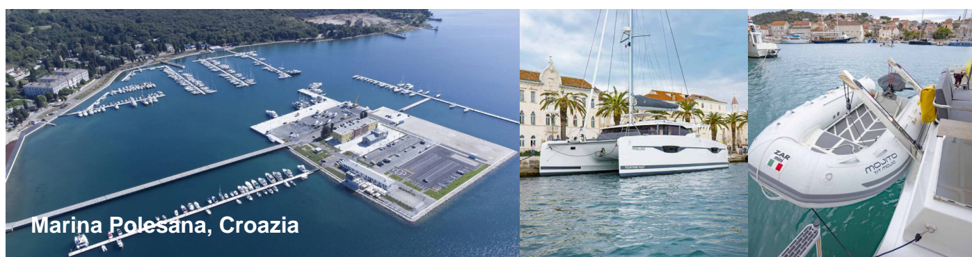
Marina Polesana, Croazia