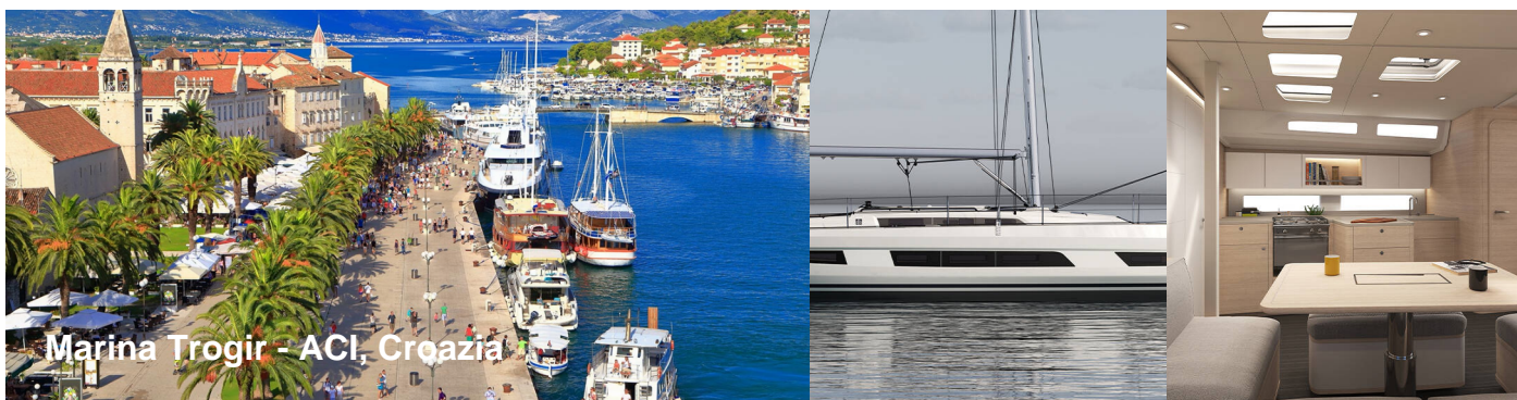
Marina Trogir - ACI, Croazia