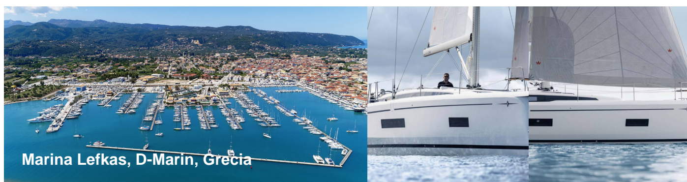
Marina Lefkas, D-Marin, Grecia