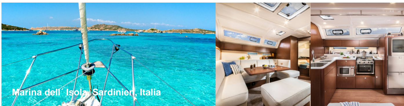
Marina dell' Isola Sardinien, Italia