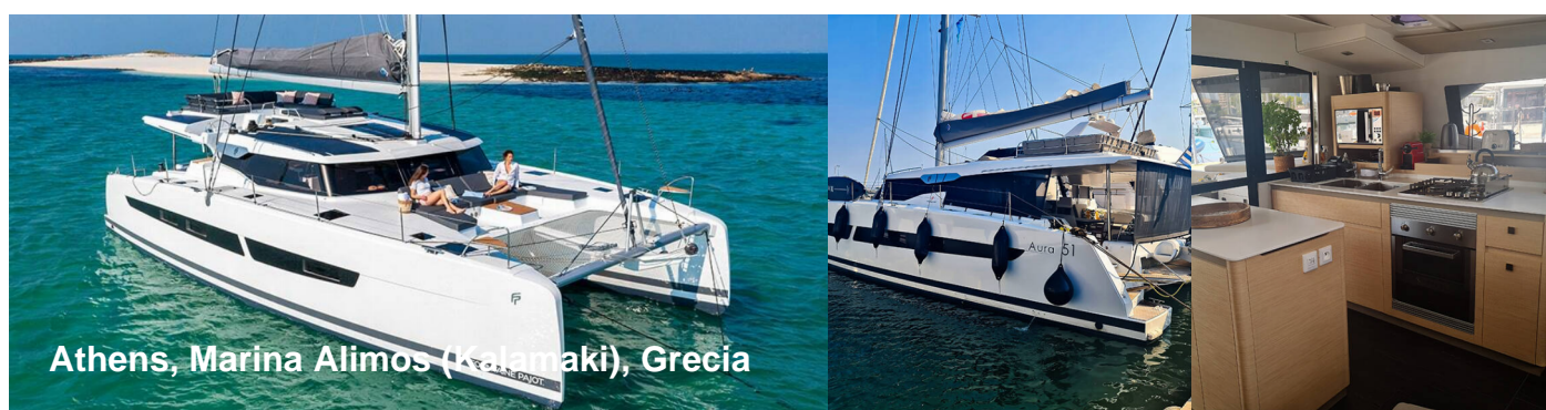
Athens, Marina Alimos (Kalamaki), Grecia