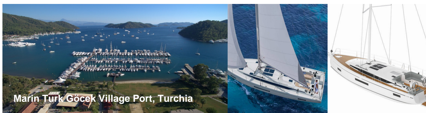
Marin Turk Göcek Village Port, Turchia