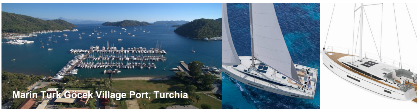
Marin Turk Göcek Village Port, Turchia