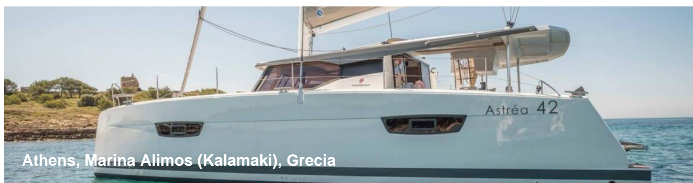
Athens, Marina Alimos (Kalamaki), Grecia