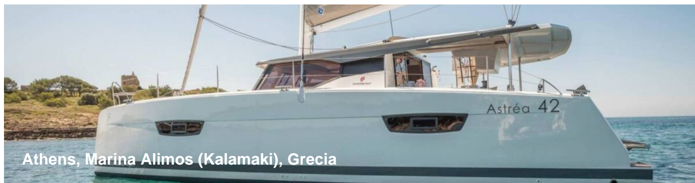
Athens, Marina Alimos (Kalamaki), Grecia