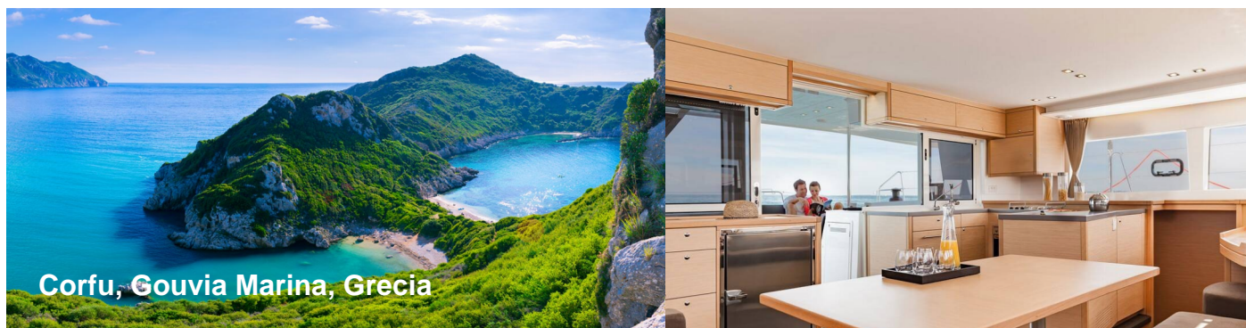
Corfu, Gouvia Marina, Grecia