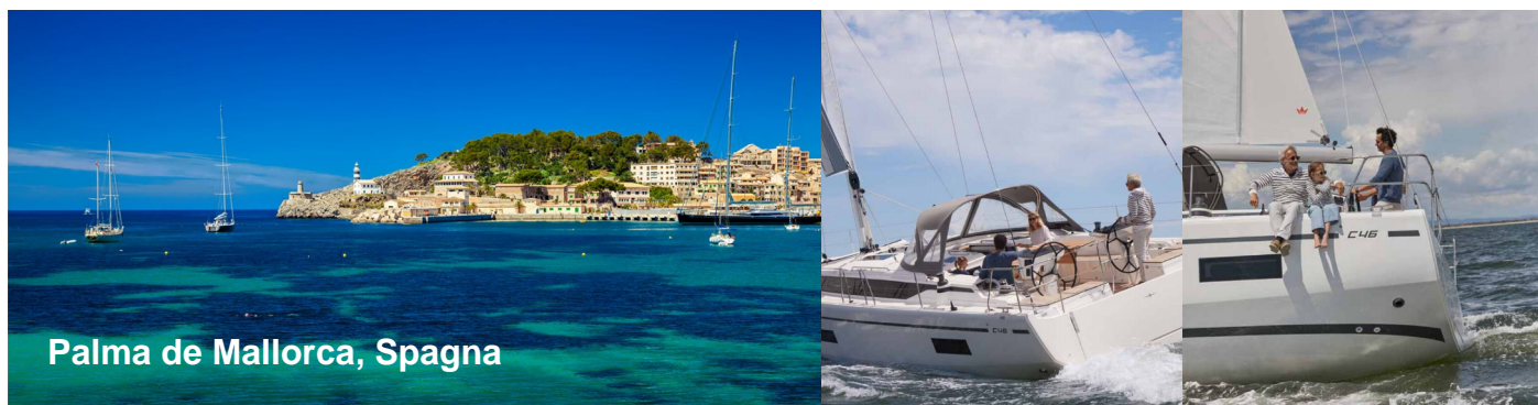
Palma de Mallorca, Spagna