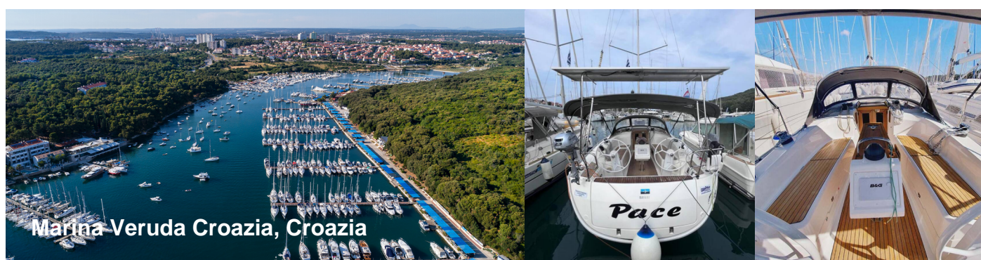
Marina Veruda Croazia, Croazia