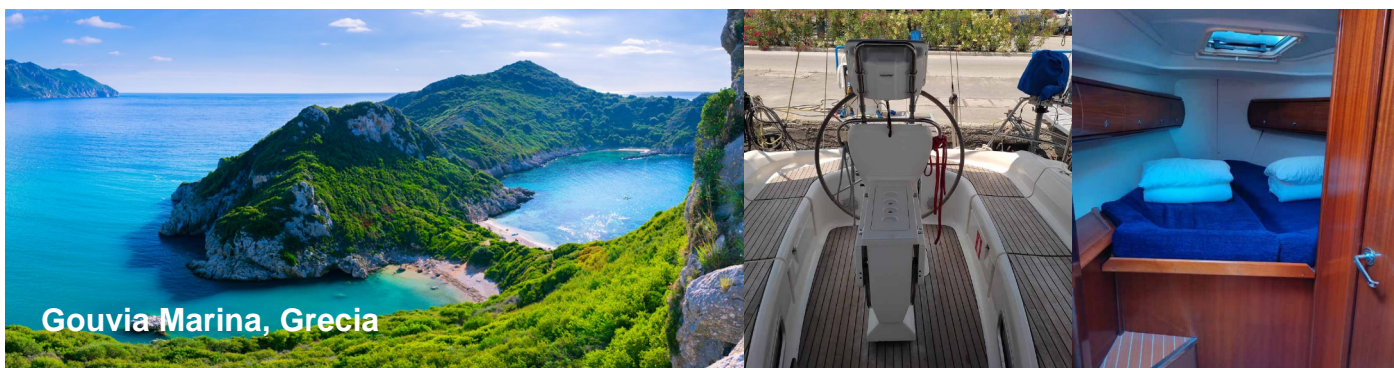
Gouvia Marina, Grecia