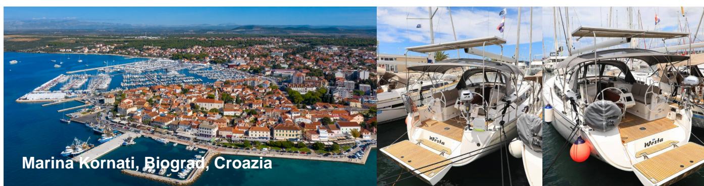
Marina Kornati, Biograd, Croazia