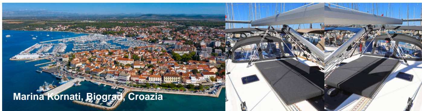
Marina Kornati, Biograd, Croazia