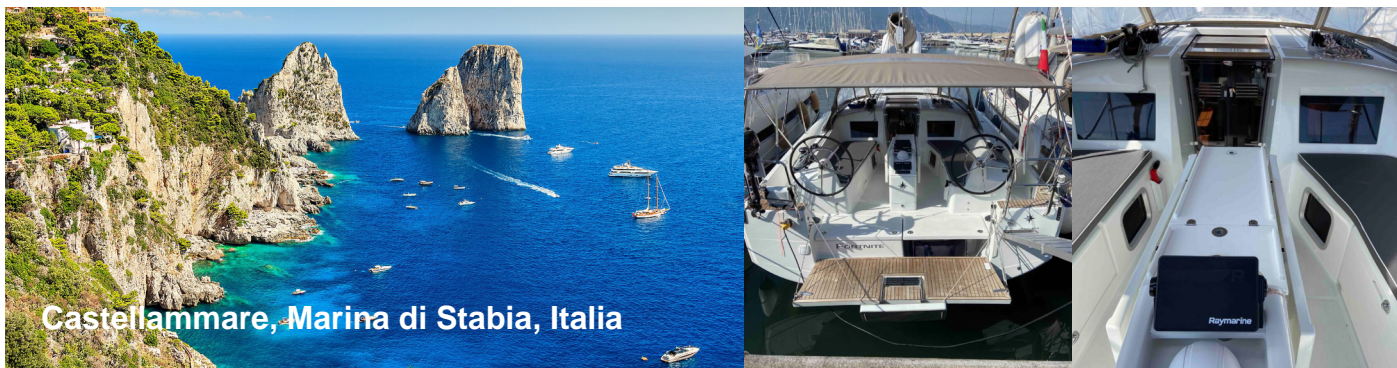
Castellammare, Marina di Stabia, Italia