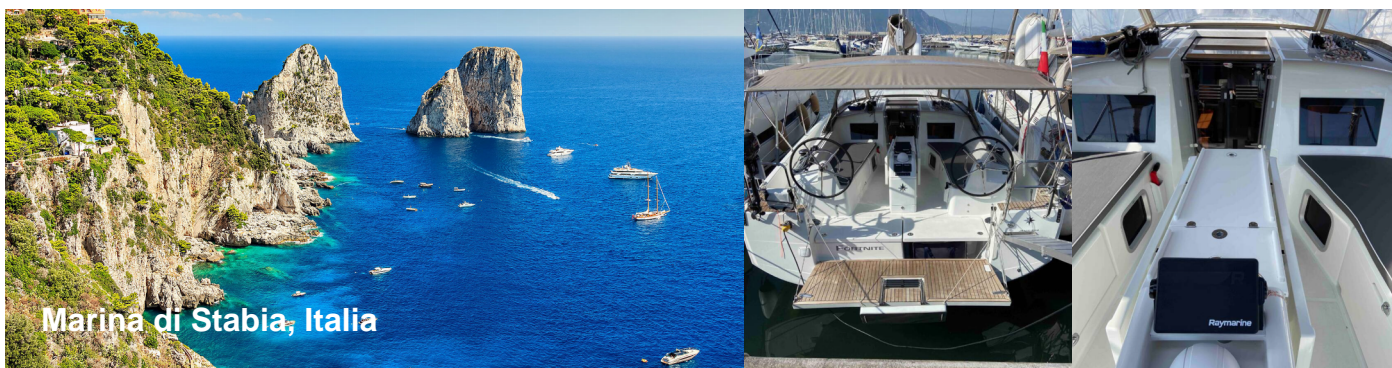
Marina di Stabia, Italia