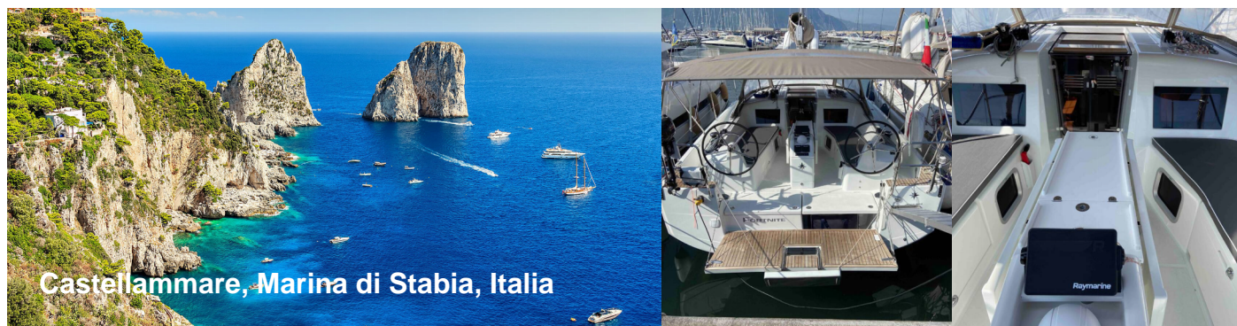
Castellammare, Marina di Stabia, Italia