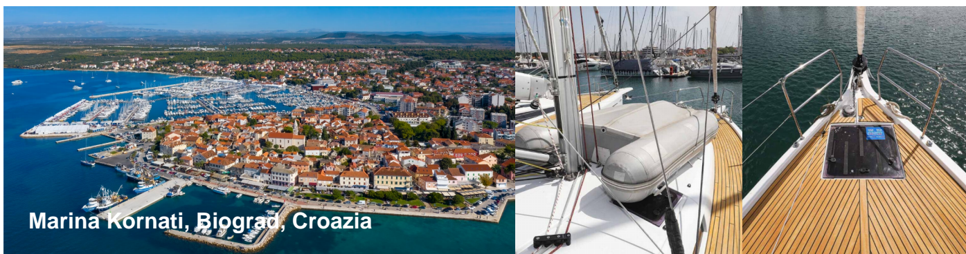
Marina Kornati, Biograd, Croazia