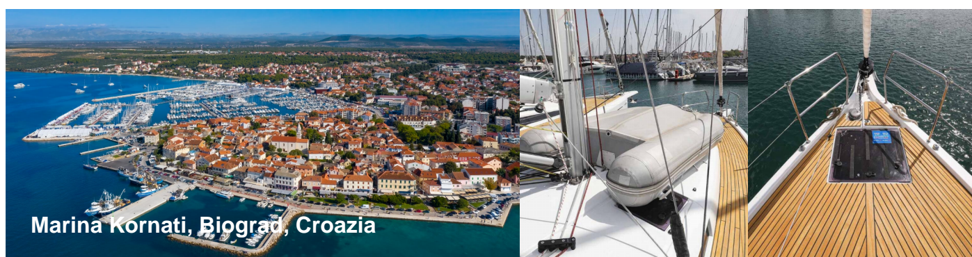
Marina Kornati, Biograd, Croazia