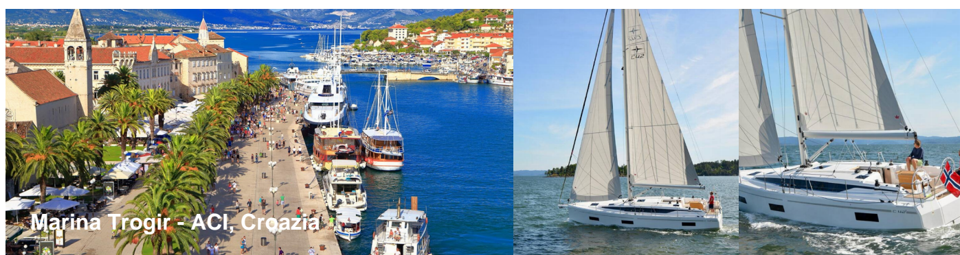
Marina Trogir - ACI, Croazia