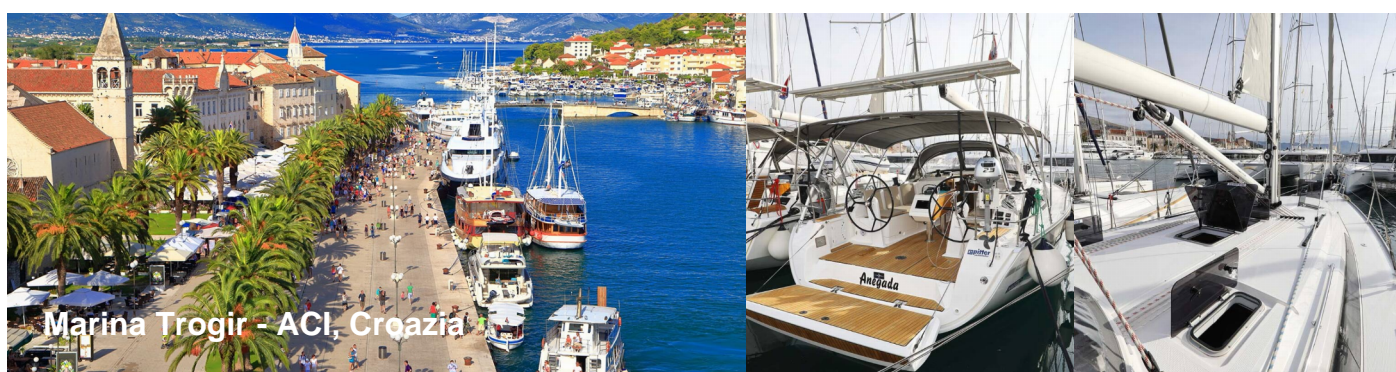
Marina Trogir - ACI, Croazia