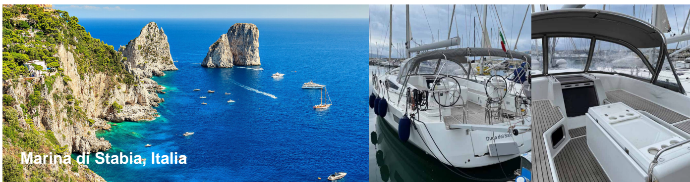
Marina di Stabia, Italia