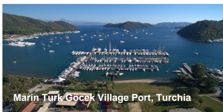
Marın Turk Göcek Village Port, Turchia