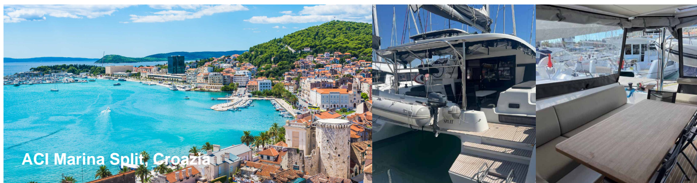
ACI Marina Split, Croazia