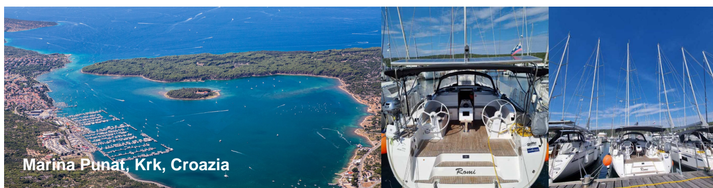
Marina Punat, Krk, Croazia