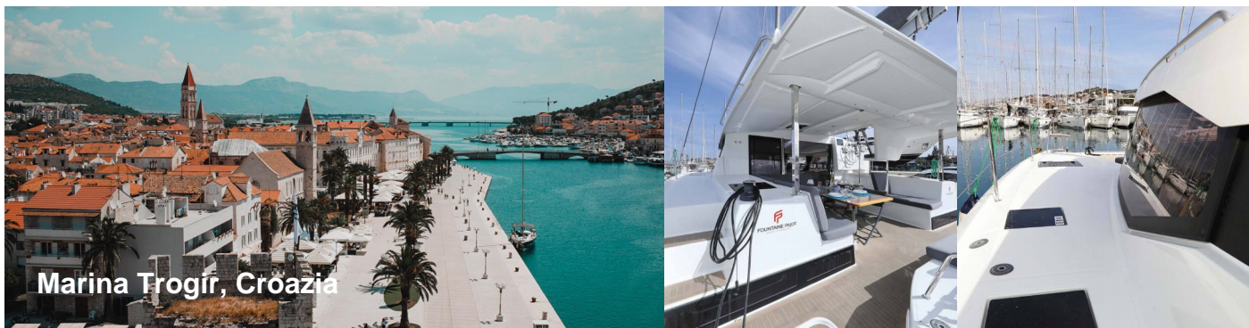
Marina Trogir, Croazia