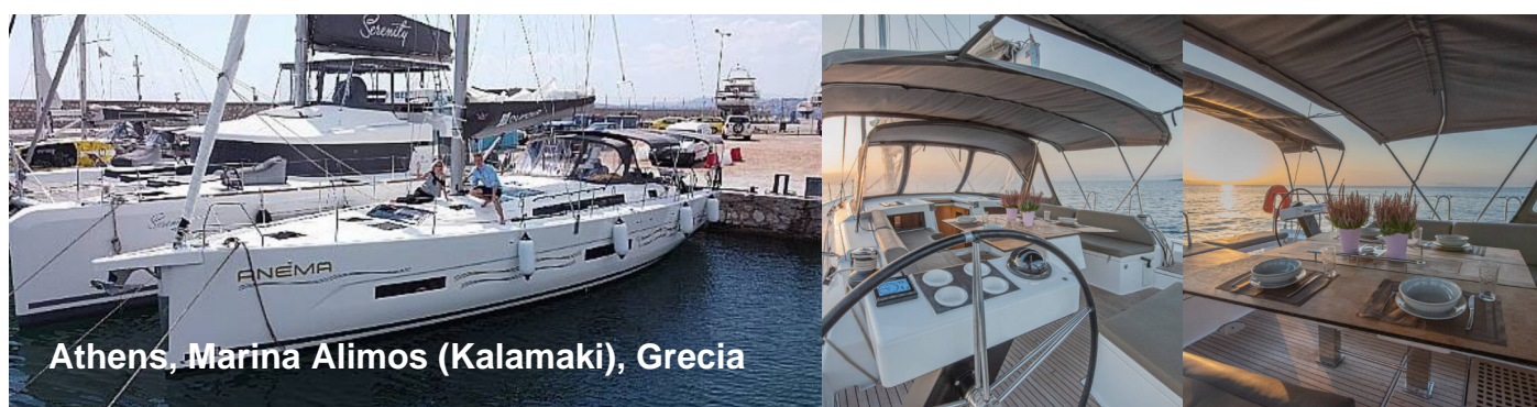
Athens, Marina Alimos (Kalamaki), Grecia