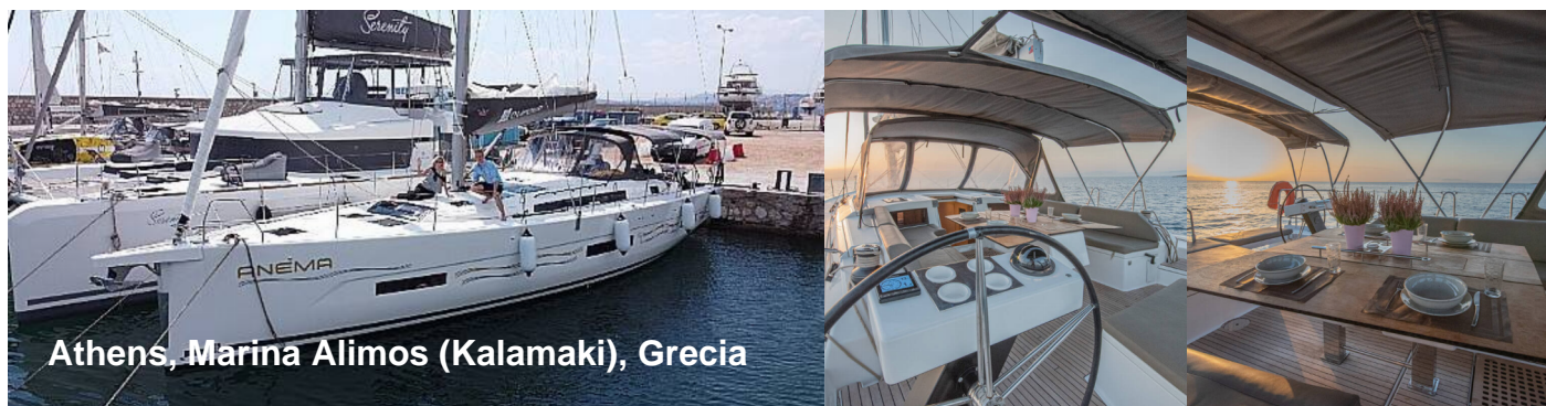
Athens, Marina Alimos (Kalamaki), Grecia