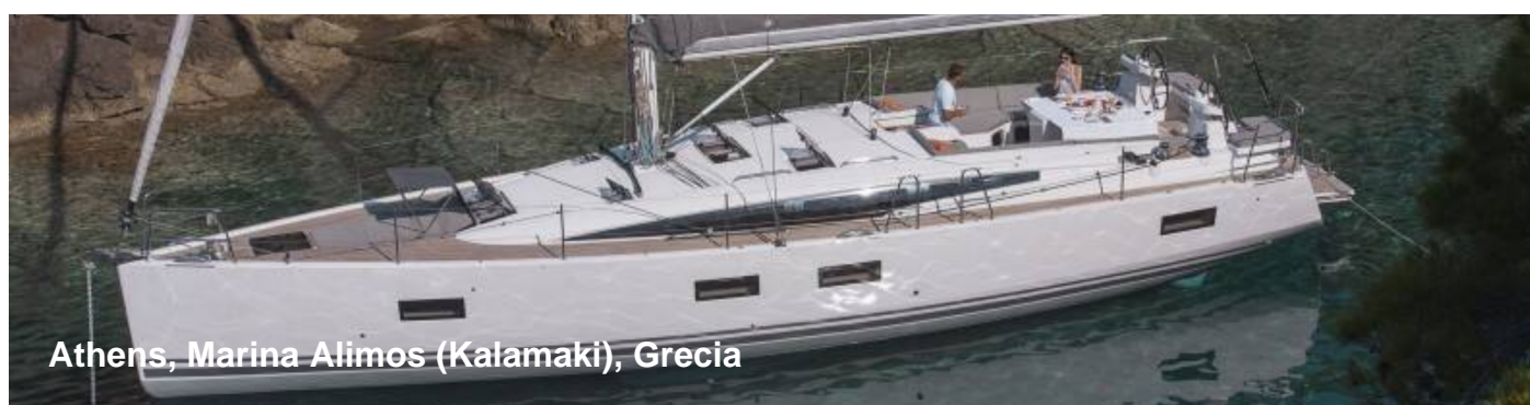
Athens, Marina Alimos (Kalamaki), Grecia