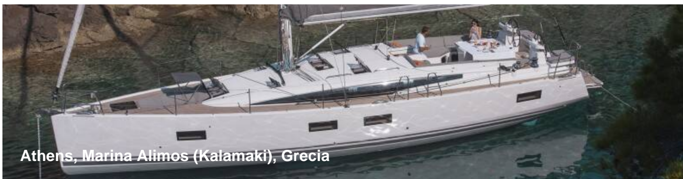
Athens, Marina Alimos (Kalamaki), Grecia