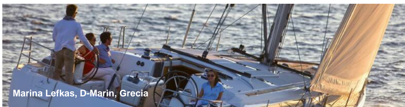
Marina Lefkas, D-Marin, Grecia