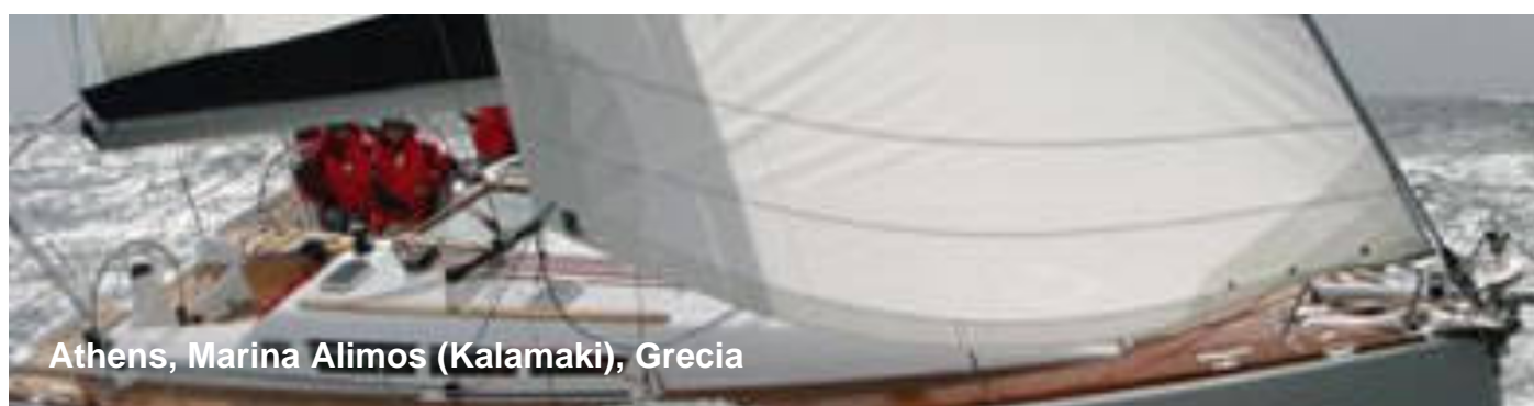
Athens, Marina Alimos (Kalamaki), Grecia