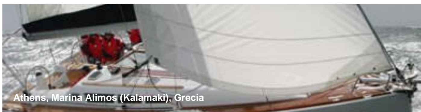
Athens, Marina Alimos (Kalamaki), Grecia