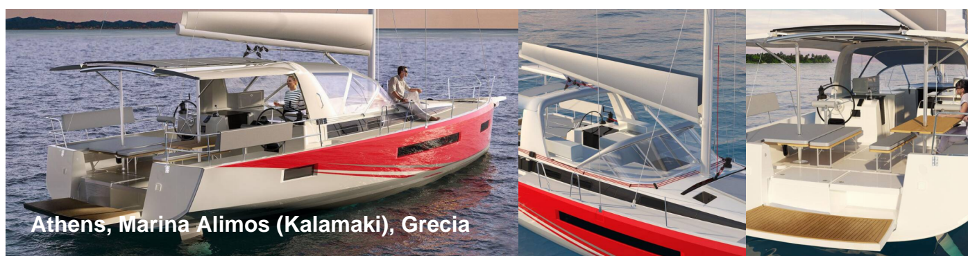
Athens, Marina Alimos (Kalamaki), Grecia