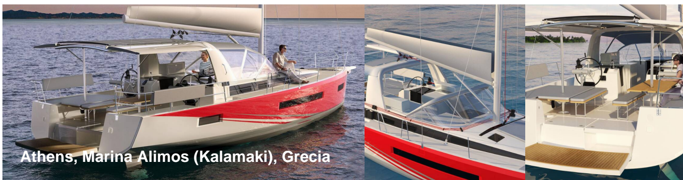
Athens, Marina Alimos (Kalamaki), Grecia